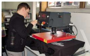
Das Heißpressen bewirken die Fixierung der mit dem Discharge-Verfahren gedruckten Motive.