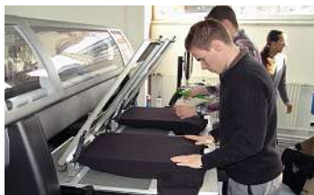
Die Doppelpaletten können mit zwei T-Shirts bespannt werden. Danach erfolgt eine parallele Bedruckung.