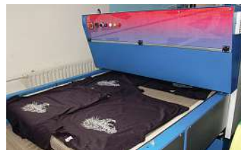
Danach werden die Shirts ganz langsam über ein Laufband durch einen Trockner transportiert.